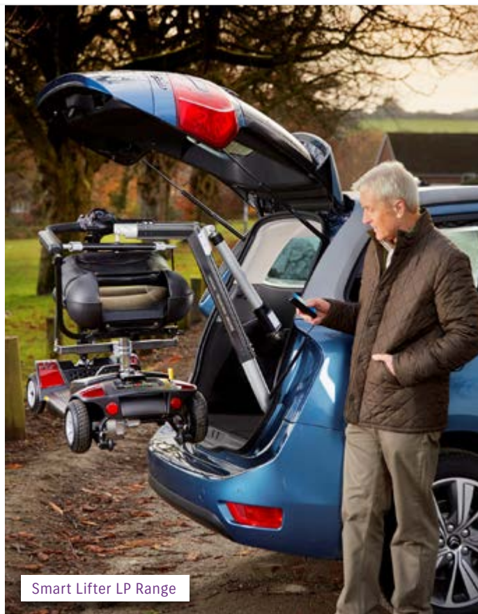
Smart Lifter LP Range