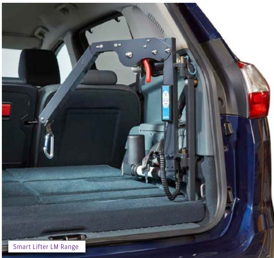
Smart Lifter LM Range

Smart Lifter LM Range - nosnost 40 kg a 80 kg