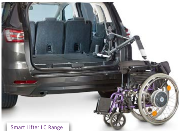
Smart Lifter LC Range

Smart Lifter LP Range – nosnost 125 kg, 150 kg a 200 kg